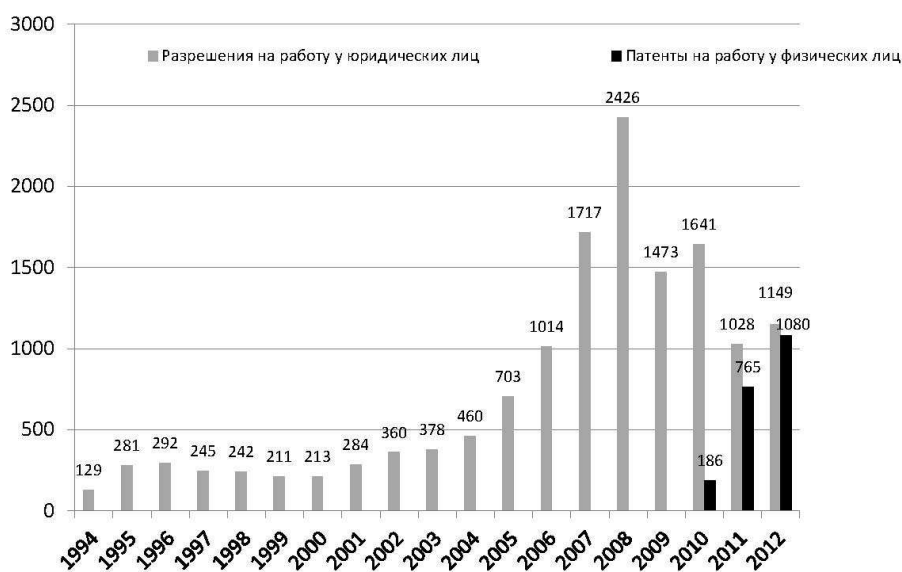
Рис. 1. Численность разрешений на работу и патентов, выданных на работу в России иностранным гражданам в 1994–2012 гг. (в течение соответствующего года), тыс.

рованных трудовых мигрантов отличается от численности зарегистрированных в несколько раз, хотя оценки первых весьма приблизительны. В результате в России было обнаружено около 2 млн. человек, которые не были учтены ранее. Перепись 2010 года «увеличила» население страны на 1 млн. человек. Можно предполагать, что это произошло из-за наличия временных трудовых мигрантов. Наши расчеты, основанные на оценке численности основных категорий незарегистрированных трудовых мигрантов в России, показывают, что в стране их может быть около 5 млн. человек. Большинство из них — граждане стран СНГ, которые имеют полное право приехать в Россию без визы, но затем не получают регистраций по месту пребывания или разрешений на работу. Многие из них живут в России на протяжении нескольких лет или периодически возвращаются домой (рис. 1).