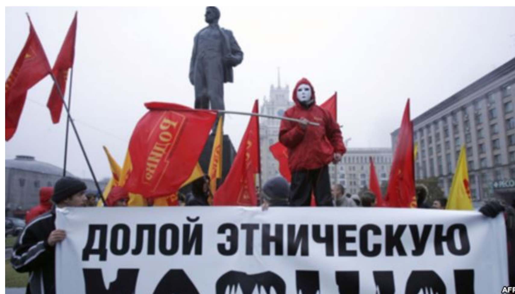
Протесты в связи с незаконной миграцией жителей бывших советских республик (архивное фото)